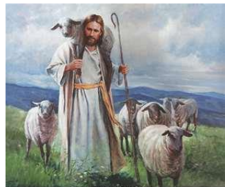
The Good Shepherd by Carl Pearson

Many of us in the baby-boomer generation can recall learning, and reciting from memory, the Twenty-third Psalm: “The Lord is my shepherd, I shall not want ... and I shall dwell in the house of the Lord for ever.” Though thousands memorized this wonderful psalm it is doubtful how many actually gave any consideration as to what it meant to have Jesus as our shepherd. This week’s Gospel reading, and the verses from John 10:1-21, begin to open up for us the significance of Jesus as shepherd.