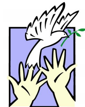
But when ... the Spirit of truth, comes, he will guide you into all truth. John 16:13

The Holy Spirit can guide individual believers and fill them with wisdom. However, there are a couple of problems. First, people need to be aware the power of the Holy Spirit is indeed available. A lot of folks don't even realize we can be filled with the Holy Spirit. And secondly, we have to invite the Holy Spirit into our hearts. He is a gentleman and He doesn't force himself on anyone. But to those who invite the Spirit in, He joyfully gives His power.