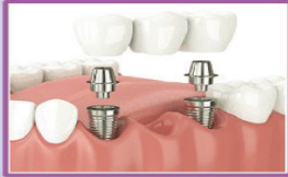
Implant- Supported Bridge