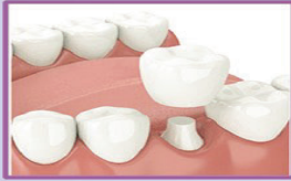
Single Tooth Dental Implant