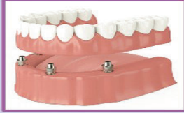
Implant- Supported Denture

Có trên 15 năm kinh nghiệm Fellow International Congress Oral Implantologists