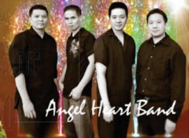
Angel Heart Band